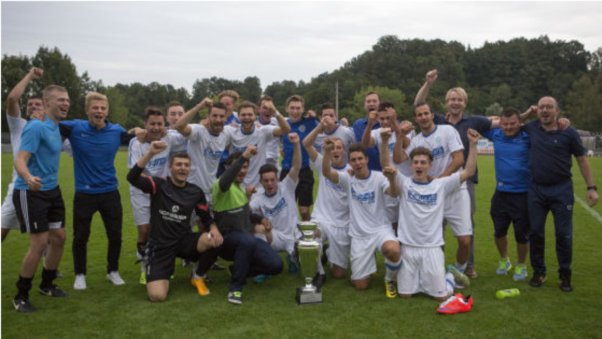
Bereits zum dritten Mal durfte der ATSV Ranshofen über den Sieg beim Innviertler Fußballcup jubeln.

Erst im Elfmeterschießen wurde der 29. Innviertler Fußballcup entschieden – Sieger ATSV Ranshofen bewies Nervenstärke.